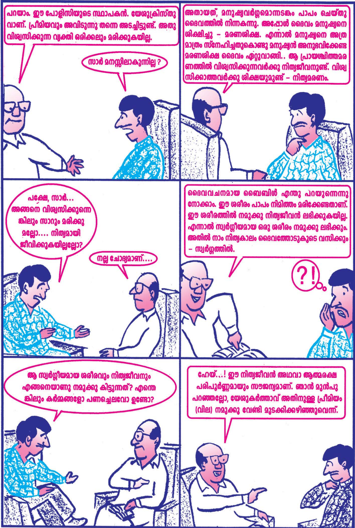
"നിങ്ങളെ വീണ്ടെടുത്തിരിക്കുന്നതു പൊന്ന്, വെള്ളി മുതലായ അഴിഞ്ഞുപോകുന്ന വസ്തുക്കൾ കൊണ്ടല്ല, ക്രിസ്തു എന്ന നിർദ്ദോഷവും നിഷ്കളങ്കവുമായ കുഞ്ഞാടിന്റെ വിലയേറിയ രക്തംകൊണ്ടത്രേ." 1 പത്രോ. 1:18